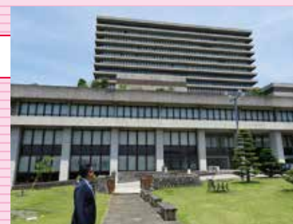
センターが整備される旧第一生命ビル(大井町)

A. 地域政策課長 県西地域を「未病の戦略的エリア」としてアピールする拠点として、未病に関する情報発信、未病の「見える化」「未病を改善する」提案等を行う施設との位置づけ。このセンターの中、或いは県西地域の温泉等地域資源を活用して未病改善に繋げていきたい。