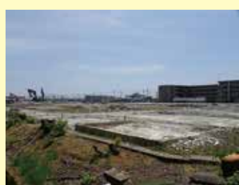
広大な前川地区空地に企業進出

有力企業の市外転出が目立つが、県の企業誘致推進策“セレクト神奈川100”の効果もあり、前川の空地に食材製造工場と研究所の進出が決定。50億円の投資と230人の新規雇用が予定される。次の新規企業の進出が望まれる。